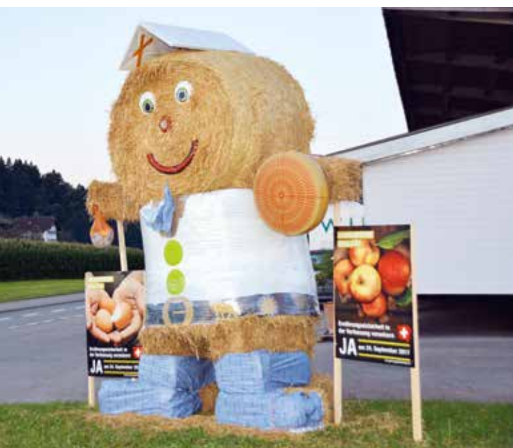
Uno dei molti soggetti paesaggistici costruiti dalle famiglie contadine in tutta la Svizzera.

Nell'ambito della campagna «Grazie, contadini svizzeri.» c'è stata un'estesa affissione di manifesti con il soggetto degli animali della fattoria nel look della stella alpina. Al contempo sono iniziati i lavori per l'elaborazione della strategia per un completo rilancio nel 2018. In estate si è concluso il concorso fotografico di agrimage.ch. Sono stati più di 1600 i fotografi che hanno fatto pervenire circa 15 500 fotografie, suddivise nelle nove categorie riguardanti l'agricoltura svizzera. La premiazione si è svolta durante la OLMA di San Gallo. Le migliori fotografie sono state riunite in un'esposizione itinerante. Sempre alla OLMA è stato inaugurato il nuovo modulo sulle patate della mostra «Erlebnis Nahrung». In totale, i moduli della comunicazione di base, hanno partecipato a 30 fiere e esposizioni. Sulla rete televisiva www.buuretv.ch è stato pubblicato un nuovo cortometraggio, la pagina facebook conta 700 nuovi fan (per un totale di 14 400) e nel portale di vendita diretta «Dalla campagna» si possono trovare 1575 fattorie e le loro offerte. Per la 25a volta è stato organizzato il Brunch del 1° agosto. 352 fattorie sparse in tutto il Paese hanno preso parte all'evento. In occasione dell'anniversario,