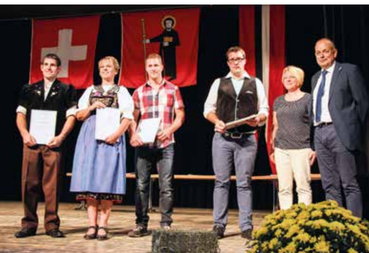
Durante la festa di consegna dei diplomi, i media agricoli hanno consegnato un premio ai migliori diplomati del 2017.

Il punto principale delle attività è stato la preparazione di dati statistici sull'agricoltura sulla base degli accordi con l'Ufficio federale di statistica e quello per l'agricoltura. A fine anno ci si è preparati alla revisione dell'indice dei prezzi d'acquisto dei mezzi di produzione agricoli. Per rendere possibile l'attualizzazione dei fattori di calcolo della produzione dei macelli per pollame, è stato svolto un sondaggio. Agristat ha come sempre stilato tre pubblicazioni: «AGRISTAT – quaderno statistico mensile», «Sondaggi statistici e stime», così come le «Statistiche lattiere della Svizzera». L'offerta di pubblicazioni è completata da informazioni e grafici sulla pagina internet. Agristat ha altresì supervisionato diversi progetti di banche dati, p. es. di Agriprof, Agora e Proviande.