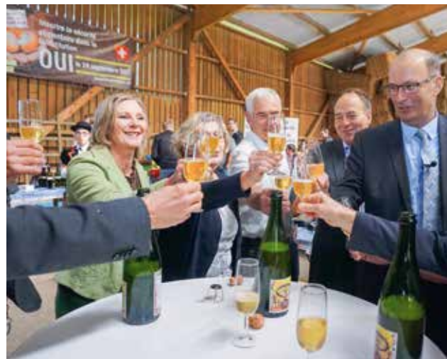
Grandi festeggiamenti per l'accettazione della votazione sulla sicurezza alimentare con più del 78%.

Il dipartimento ha proseguito con il progetto per la nuova chiave di riparto dei contributi delle organizzazioni di produttori e ha avuto numerosi contatti con le organizzazioni, che in futuro dovranno aumentare i contributi a favore dell'USC. Nel mese di novembre l'Assemblea dei delegati ha approvato la nuova chiave di riparto, in modo da renderla attiva già a partire dal 2018.