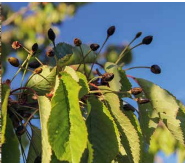
Il gelo tardivo di aprile ha causato grandi danni alla vite e alle ciliegie.