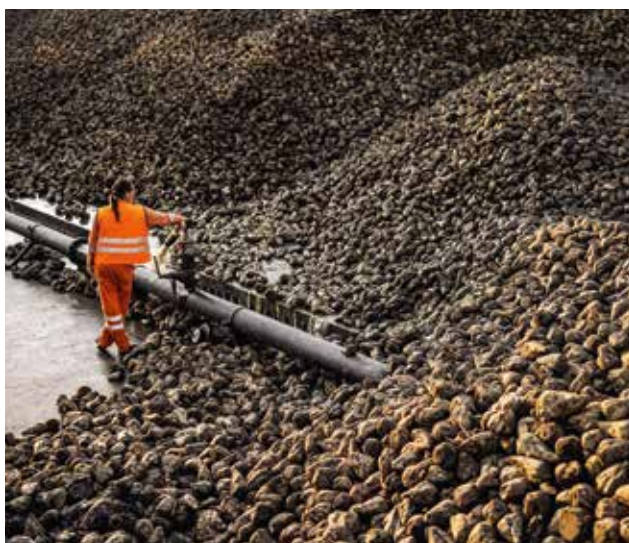
Dopo due anni di magra, il raccolto delle barbabietole da zucchero è tornato ad essere buono.

Le inaspettate gelate del mese di aprile hanno colto di sorpresa molte colture di frutta e bacche nel periodo di fioritura o quando erano già presenti dei piccoli frutti. A dipendenza dall'azienda e dalle quantità, i danni sono stati molto diversi. I raccolti sono comunque stati particolarmente bassi: la metà per quanto riguarda ciliegie e albicocche, per le prugne due terzi rispetto a un raccolto normale e le pere e le mele raccolte sono state circa il 75%, mentre fragole e lamponi hanno raggiunto l'80%. Dopo un ottimo primo sviluppo, le gelate hanno colpito duramente i vigneti rovinando in modo importante le uve praticamente in tutta la Svizzera. Nel corso dell'estate, in alcune regioni, si sono inoltre registrati ingenti danni causati dalla