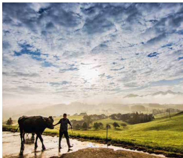
La fotografia vincitrice del concorso fotografico Agrimage di «Grazie, contadini svizzeri.»

Questa sezione è responsabile dell'accoglienza, l'amministrazione e la gestione di diversi immobili e fondazioni con sede in otto regioni della Svizzera tedesca. Anche quest'anno si sono resi necessari diversi lavori di manutenzione e riparazione. Anche lo studio d'architettura e edilizia agricola con le quattro sedi di Trimmis, Weinfelden, Küssnacht e Heiligenschwendi viene amministrato da questa sezione.