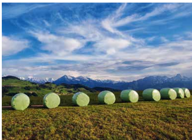
Nel 2017 l'USC ha iniziato un progetto per il riciclaggio della pellicola che fascia le balle di insilato.

A causa del cambiamento strutturale, il numero dei membri di GQ-Carne Svizzera è sensibilmente diminuito nel corso del 2017. Grazie alla buona collaborazione con partner, clienti e organi di controllo si è potuto continuare ad affermare il programma «GQ-Carne Svizzera» sul mercato della carne. Il programma per il vitello Swiss Quality Veal di Agriquali, in collaborazione con Transgourmet e la Bell AG ha riscontrato un buon successo. Grazie all'eccellente qualità è aumentata la richiesta e il numero delle macellazioni è potuto essere ulteriormente incrementato. Il nuovo programma per i produttori di pesce è stato presentato a Lucerna in occasione della Suisse Tier 2017, con esso i produttori svizzeri di pesce possono differenziare meglio i loro prodotti da quelli importati.