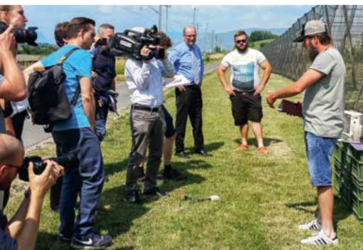
Nel corso di una conferenza stampa nello Seeland, l'USC in collaborazione con i contadini, ha informato sul tema fitosanitari e profilassi.

Le gelate tardive di fine aprile hanno causato enormi danni alla produzione viticola e a quella frutticola. L'USC ha, subito dopo le gelate, coordinato una tavola rotonda con i settori maggiormente colpiti, stilando un primo rapporto dei danni e organizzando un incontro con il Governo. Nel frattempo ha richiesto a Fondsuissse un supporto finanziario, che è stato fornito sotto forma di contributi a fondo perso destinati ai contadini maggiormente colpiti. Il direttore dell'USC ha poi depositato in Parlamento una mozione sul tema. Questa richiede la creazione di linee guida di base, in modo che il settore agricolo in futuro possa assicurarsi meglio contro i rischi della natura.